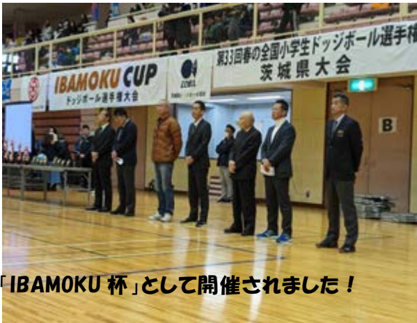
「IBAMOKU 杯」として開催されました！

この大会は、日本ドッジボール協会主催の全国大会に向けて大事な大会と位置付けられているとともに、小学6年生にとっては最後の大会ということもあり会場は熱気に包まれていました。出場選手そしてそのご父兄の皆様方と大会スタッフを合わせると約1000名の方が関わる大会となりました。